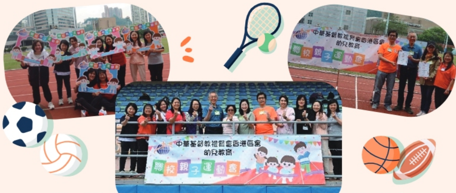
校監、校董、各校校長及小學校長一起合照，齊齊為運動會作出無限支持!

禮賢會幼兒教育屬下八間幼稚園及幼兒園，於2023年12月2日(星期六)於葵涌運動場舉行「聯校親子運動會」。當天邀請了校監、校董及幼兒教育總主任一同主持開幕禮及起動禮。活動共有接近一千位師生及家長參與，大家施展渾身解數進行各區體能活動，彼此打氣和支持，全力以赴地完成各項活動。而全日最緊張刺激便是「家師接力賽」，看台上的幼兒更為各老師及爸媽大聲吶喊，當然最後每一位運動健兒都獲得「傑出運動員」之獎牌。