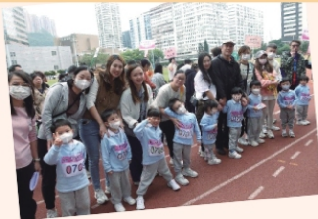
眾嘉賓與家長及幼兒們一同進行起步禮