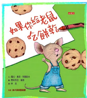
書名：《如果你給老鼠吃餅乾》 作者：勞拉·喬菲·努梅羅夫

書本內容介紹：一隻穿著背帶牛仔褲、背著小書包的小老鼠，走近一個坐在院子裏吃餅乾、看圖畫書的小男孩。這時如果他給了小老鼠一塊餅乾，會發生什麼事呢？如果你請老鼠吃餅乾，他就會跟你要一杯牛奶。你給他牛奶，他一定會跟你要吸管。一照鏡子，他就會說頭髮也該剪了。他一定會跟你要一把剪指甲的小剪子…… 閱後感受：透過送給老鼠吃的一塊餅乾開始，既是故事的結尾也是它的開始，串出一個可以共讀的故事。可以一邊讀，一邊揣測老鼠主角下一步的要求，自然鍛鍊出豐富的語文能力。家長和幼兒閱讀時，家長可鼓勵幼兒發揮想像力，自由創作故事，延續新的故事結局。